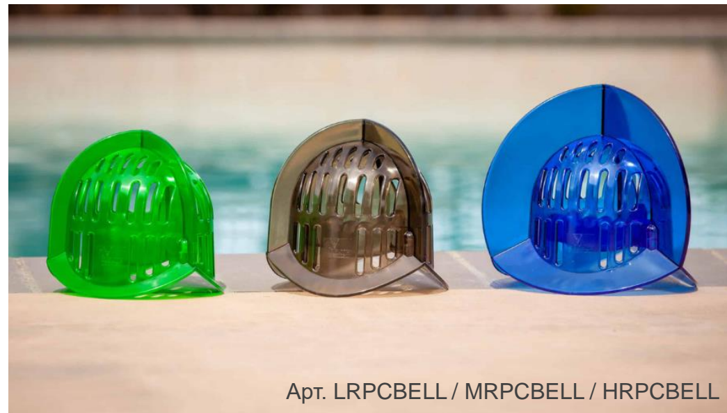
Арт. LRPCBELL / MRPCBELL / HRPCBELL

Позволяют варьировать уровни сопротивления от высокой скорости до максимального наращивания мышечной массы, укрепляя нужные участки тела. Обеспечивают полный спектр уровней нагрузки для клиентов от реабилитации до элитных спортивных тренировок.