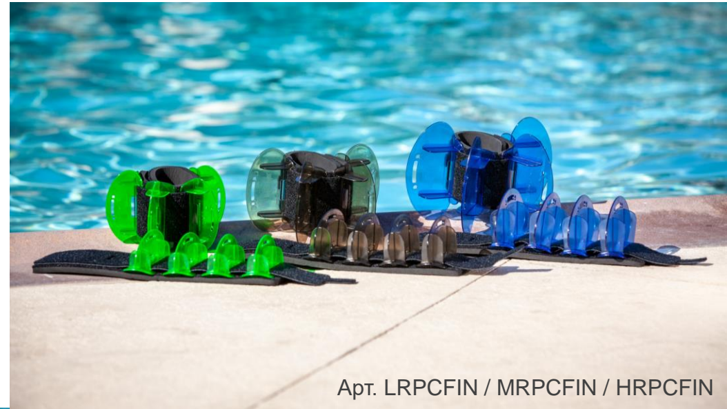
Арт. LRPCFIN / MRPCFIN / HRPCFIN

Созданы для динамичных высокоинтенсивных тренировок с низкой ударной нагрузкой. Дают возможность тренировать любые мышцы и могут фиксироваться как на руках, так и ногах. Тренировки с Aqualogix Hybrid Fins позволяют укреплять, тонизировать мышцы и сжигать калории более эффективно, чем при большинстве тренировок на суше. Также они отлично подходят для развития скорости и координации в воде и для реабилитации.